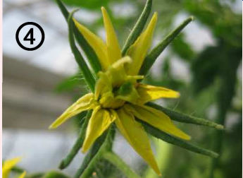
④ 中心の1本がめしべ