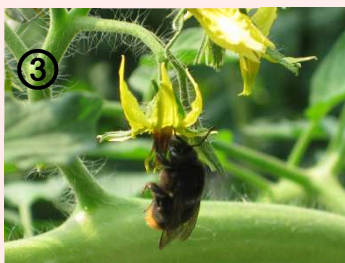
③ 食事をするとき体に